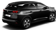
Negro Perla Nera