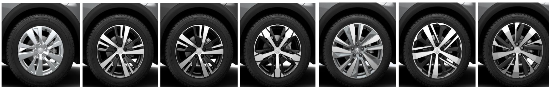
Llanta de aleación 17" "Chicago"