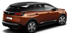
Metallic Copper (Cobre)