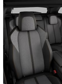
C&T Imila Mistral Tramontana