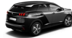
Gris Platinum / Negro Perla Nera