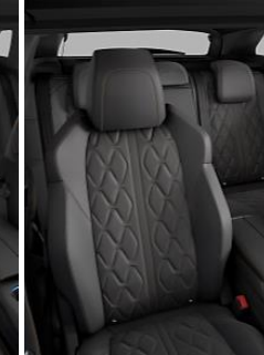
Cuero Nappa Mistral Amloz