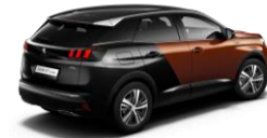
Metallic Copper (Cobre) / Negro Perla Nera