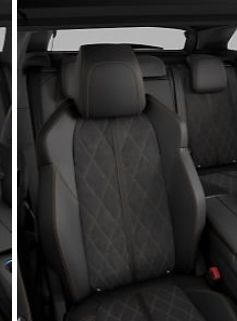
Alcantara® Mistral Gramloz